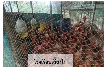
โรงเรือนเลี้ยงไก่