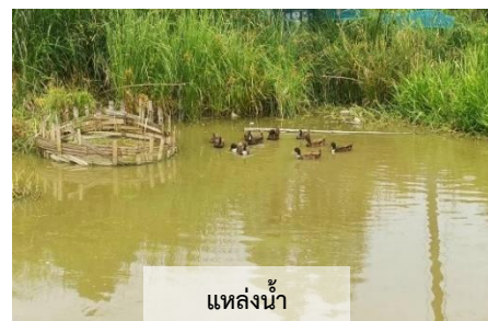
แหล่งน้ำ