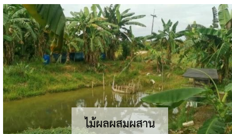
ไม้ผลผสมผสาน